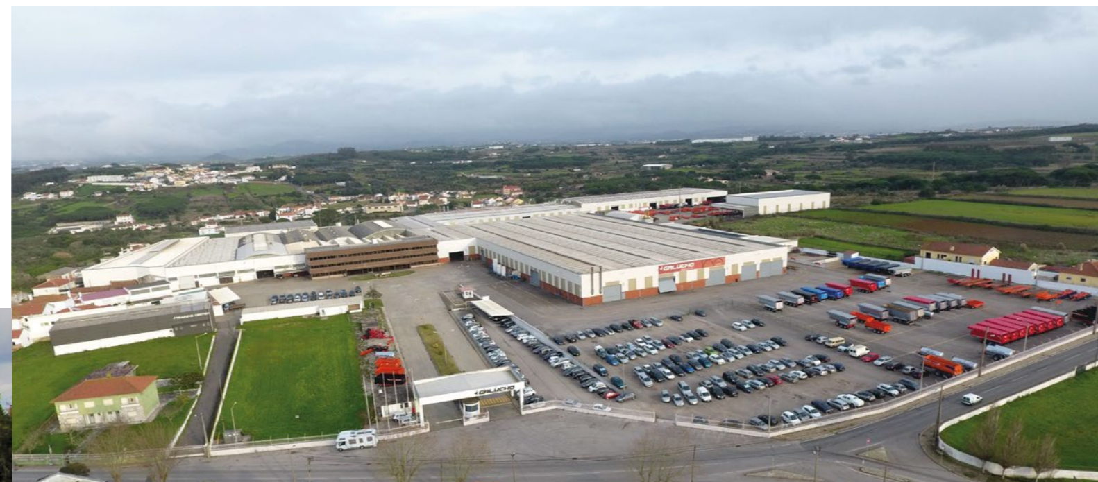
Siège de Galucho São João das Lampas | Sintra | Portugal

Avec plus de 100 ans d'activité, Galucho est actuellement spécialisée dans la fabrication d'équipements pour l'agriculture et le transport de marchandises et dispose de pôles de production au Portugal (São João das Lampas et Albergaria) et de quelques partenaires stratégiques pour la distribution de ses équipements sur les marchés internationaux, ayant déjà exporté tout au long de son histoire dans plus de 100 pays.