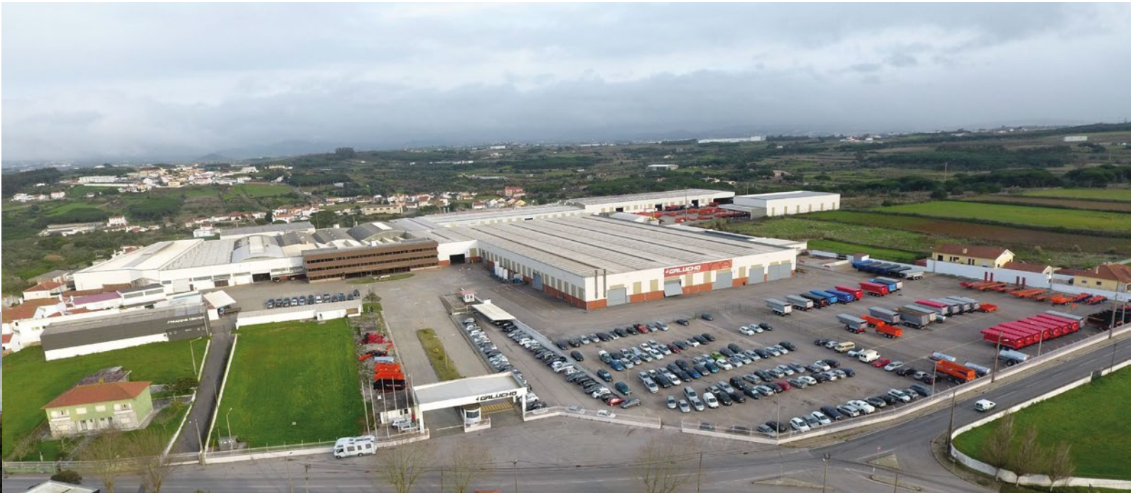
Sede da Galucho São João das Lampas | Sintra | Portugal

Com mais de 100 anos de atividade, atualmente a Galucho é especializada no fabrico de equipamentos para a agricultura e para transporte de mercadorias e conta com polos de produção em Portugal (São João das Lampas e Albergaria) e alguns parceiros estratégicos para a distribuição dos equipamentos nos mercados internacionais, já tendo exportado ao longo da sua história para mais de 100 países.