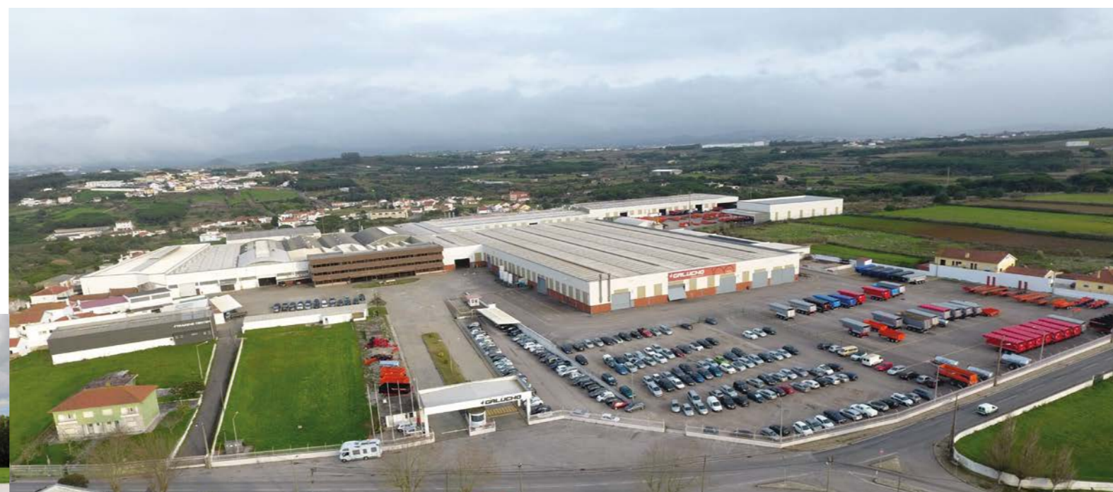
Sede da Galucho São João das Lampas | Sintra | Portugal

Atualmente, a Galucho opera a nível global, diretamente ou através de diversos parceiros estratégicos, a partir dos seus locais de produção na Europa (Portugal) e África (Argélia).