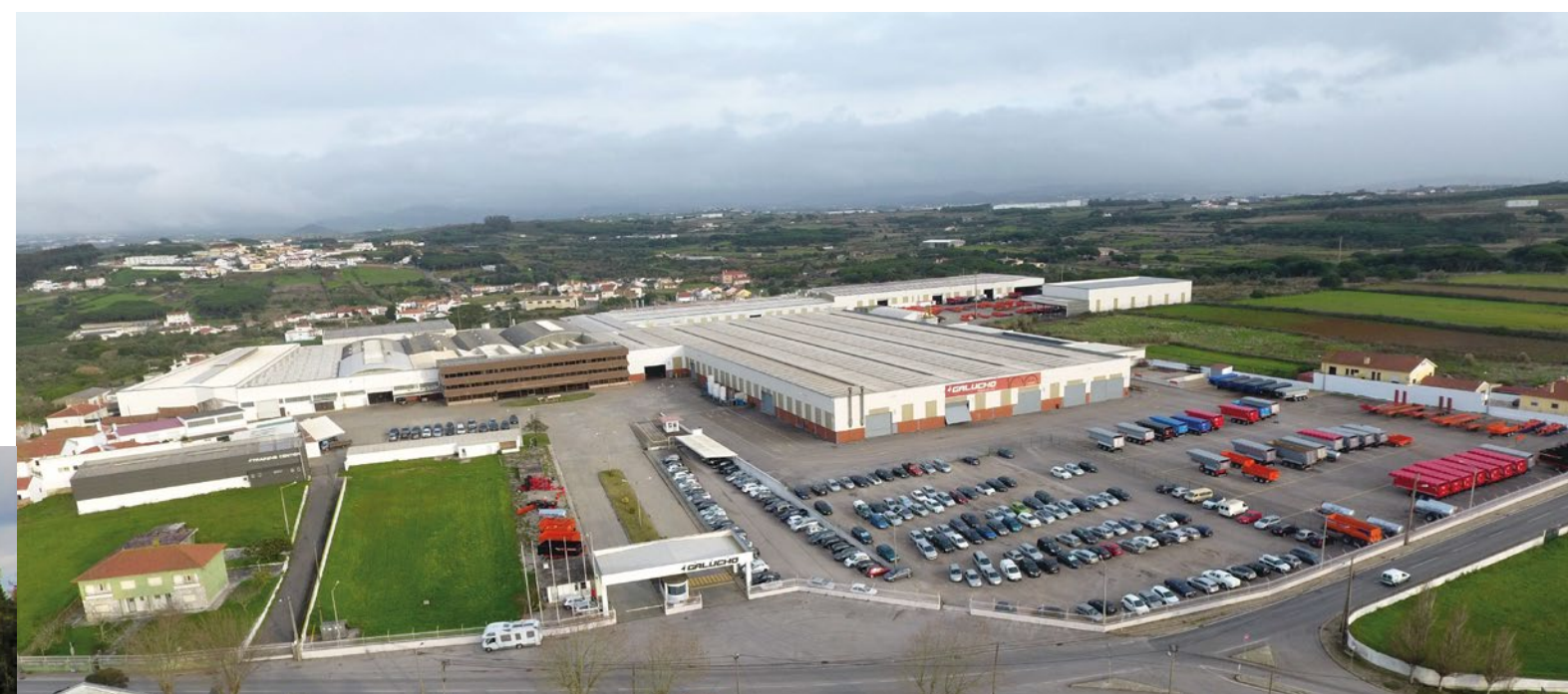
Sede da Galucho São João das Lampas | Sintra | Portugal

Com mais de 100 anos de atividade, atualmente a Galucho é especializada no fabrico de equipamentos para a agricultura e para transporte de mercadorias e conta com polos de produção em Portugal (São João das Lampas e Albergaria) e alguns parceiros estratégicos para a distribuição dos equipamentos nos mercados internacionais, já tendo exportado ao longo da sua história para mais de 100 países.